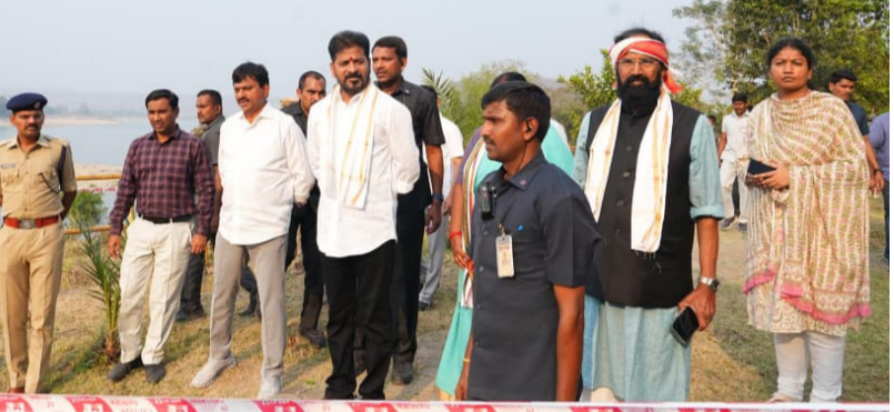
దేవదుల ఇంటికి పాయింట్ వద్ద మోటార్లను పరిశీలించిన అనంతరం ప్రాజెక్టు స్థితిగతులపై ముఖ్యమంత్రి సమీక్ష నిర్వహించారు. అనంతరం ముఖ్యమంత్రి మాట్లాడుతూ, "తెలంగాణ నీటి హక్కుల విషయంలో శాశ్వత పరిష్కారం కోరుకుంటున్నాం. ఒక ప్రణాళికాబద్ధంగా ప్రాజెక్టులను పూర్తి చేయాలని ముందుకు వెళుతున్నాం. అవసరమైన నిధులను సమీకరిస్తున్నాం. ఎంతటి జరిమిమైన సమస్య అయినా చర్యల ద్వారా పరిష్కారం చేయవచ్చని

దశ, హైదరాబాద్ : గోదావరి నదీ జలాల వినియోగం, దానిపై తలెత్తిన వివాదాలు, ప్రాజెక్టుల నిర్మాణం వంటి అన్ని అంశాలపై శాసనసభ బడ్జెట్ సమావేశాల్లో సమగ్రంగా ఒకరోజు చర్చిస్తామని ముఖ్యమంత్రి ఎ. రేవంత్ రెడ్డి చెప్పారు. గోదావరి, కృష్ణా జలాల్లో తెలంగాణ హక్కులను కాపాడుతామని, ఆ విషయంలో ఎవరికీ ఎలాంటి సందేహాలు అక్కరలేదని పునరుద్ఘాటించారు. ములుగు జిల్లా కన్వయింగుడం మండలం జె. చౌకారావు దేవదుల ఎత్తిపోతల పథకం పంప్ హౌస్ ను ముఖ్యమంత్రి పరిశీలించారు. ఇంజనీర్లను అడిగి వివరాలు తెలుసుకున్నారు. మంత్రులు ఉత్తమ కుమార్ రెడ్డి, ధనసరి అనసూయ సీతక్క, పొంగులేటి శ్రీనివాస రెడ్డి, సీఎం సలహాదారు వేం సరేందర్ రెడ్డి తో పాటు ఎంపీ, ఎమ్మెల్యేలు, అధికారులతో కలిసి