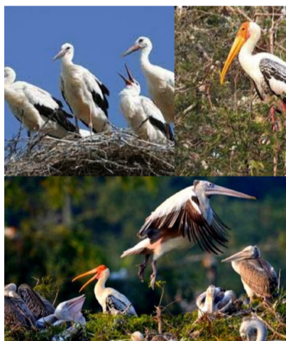
ప్రతి ఏడాది జనవరి, ఫిబ్రవరి నెలల్లో వేలసంఖ్యలో సైబీరియన్ కొంగలు, ఇతర వలస పక్షులు.

విదేశీ అతిథి పక్షులకు స్వర్గధామంగా మహబూబాబాద్ జిల్లా నెల్లికుదురు మండలం మేచరాజుపల్లి.